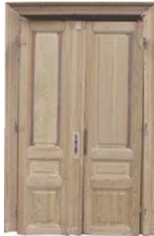
Nach dem Ablagen