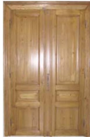
Restauriert und lackiert

Restaurieren von Weichholzmöbeln heisst in der Regel: einzelne Teile neu anfertigen, Türen und Schubladen "gängig machen", Laufleisten und FüÙe erneuern und schleifen, schleifen, schleifen (oft auch von Hand) . . . Gerade beim Schleifen ist Fingerspitzengefühl und Erfahrung angesagt: Ein bisschen zu viel zerstört die Patina und ruiniert damit das ganze Möbel.